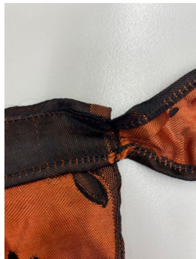
Abb. 5: Schürzenbänder