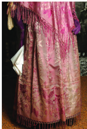
Abb. 11: Seidenkombination, Wendland, 19. Jh., mit zwei Stufen.

Das Dreieckstuch befindet sich mit den oben angegebenen Maßen nicht im Rahmen einer Standardgröße für heutige Tücher für Erwachsene, welche meist eine Länge von 160 cm und eine Höhe von 60 cm aufweisen. Eine eindeutige Konfektionsgröße lässt sich für dieses Kleidungsstück nicht feststellen. Unserer Meinung nach lässt sich dieses Tuch egal bei welcher Körpergröße-, form- oder -länge tragen.