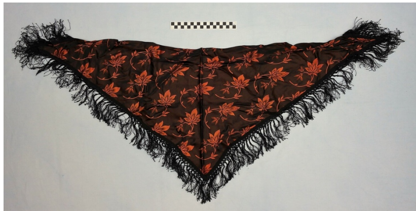
Abb. 8: Vorderansicht des Tuches (TRC 2016.0540b).

Auf dem schwarzen Außenstoff des Tuches wurden orangefarbene Blumen gestickt. Auf der Innenseite des Tuches sind die Farben genau in entgegengesetzter Variante aufzufinden: Der Satinstoff ist Orange und die Blumen-Applikationen sind Schwarz (vgl. Abb. 9). An den beiden kurzen Seiten des Tuches befindet sich eine schwarze Applikation am Rand, an dieser wiederum schwarze Verknotungen und Fransen vorzufinden sind. Wir vermuten, dass es sich hierbei um geknüpfte Fransen handelt. Die Gesamtlänge der Applikationen beläuft sich auf ca. 7 cm (vgl. Abb. 10).