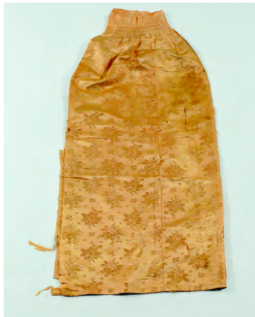
Abb. 2: Goldene Seidenschürze, Wendland, 19. Jh.

Die folgenden drei Einzelteile der Schürze wurden durch die Technik des Nähens zusammengefügt: