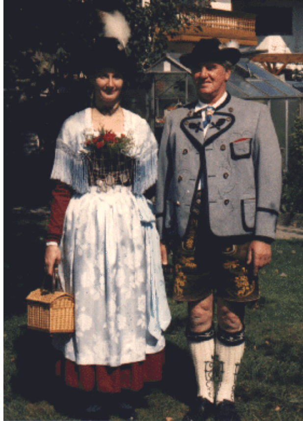
Abb. 14: Werdenfelser Gebirgstracht.

man ein schwarzes Mieder mit silbernen Haken und silbernem Geschnür. Schultertuch und Schürze sind aus Seide, wobei das Schultertuch noch lange handgeknüpfte Fransen besitzt. Der Hut ist ein Werdenfelser Scheibling und als Hutschmuck wird ein Adlerflaum getragen. Die Haare werden dabei zu einer Gretlfrisur geflochten. Zur Tracht gehören auch handgestrickte Strümpfe, schwarze Lederschuhe in Werdenfelser Form und ebenso als Unterwäsche ein weißer, spitzenbesetzter Brustlatz, wie ein Unterrock und die sogenannte Tanzhose. 16