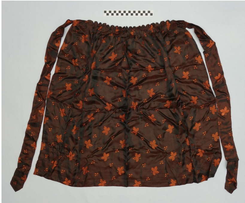
Abb. 1. Ansicht der Schürze (TRC 2016.0540a).