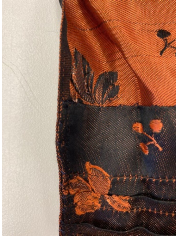
Abb. 7: Seitenränder.