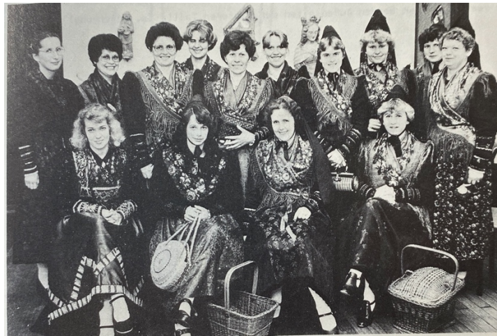
Abb. 13. Frauen des Trachtenvereins Nüdlingen, Vorrhön, um 1980.

So kleideten sich bspw. ledige Bauernmädchen um 1850 an Sonn- und Feiertagen neben einer Bänderhaube auch mit Mieder, weißem Fürtuch, plissiertem Rock, Mothen, Halstuch, Kette, Strümpfen in Weiß oder Blau ebenfalls eine Schürze, die wie das dazu getragene Halstuch ein Rosenmuster besaß (vgl. Abb. 13). Beim Tanz wurde die bunte Schürze jedoch gegen eine weiße ausgetauscht. 14 Die an Sonn- und Feiertagen getragene Schürze bestand aus Duchè, Satin, Seide, Baumwolle, Wolle oder „Pers“. Farblich wurden diese auf den Rock und den Mutz abgestimmt. Verzierungen wie Stepperei oder Stickerei waren unterhalb des Schürzenbundes aufzufinden. Die seitlichen Bänder ermöglichten der tragenden Person, diese nach hinten um den Rücken oder nach vorne um die Taille festzubinden. Dadurch hingen Bänder und Schleifen seitlich nach hinten oder vorne herab. 15