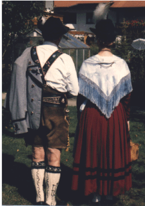
Abb. 15: Werdenfelser Gebirgstracht.