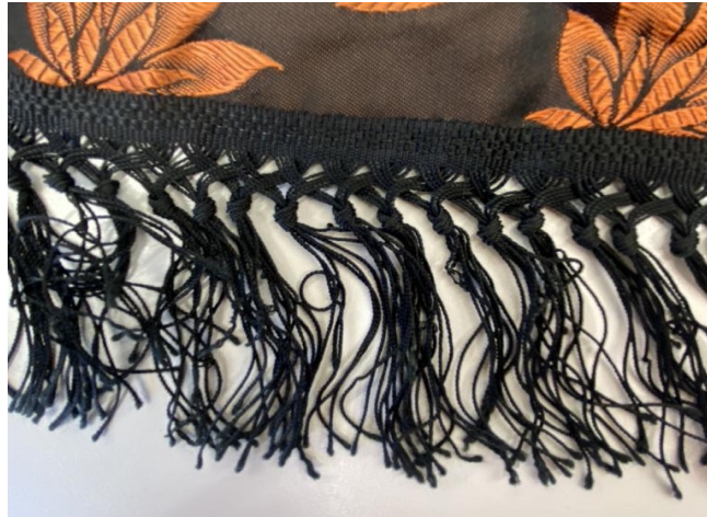
Abb. 10: Besatzstück mit angeknüpften Fransen.