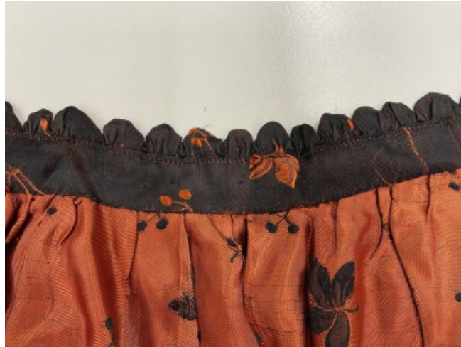
Abb. 6. Schürzenbund.

Wie sehr gut zu sehen ist, hat die Schürze durch die unterschiedliche Breite des oberen und unteren Bündchens an den Seiten zwei schräg verlaufende Saumkanten, so dass die Form der Schürze einem Trapez ähnelt. Um die kürzere Seite der Trapezform zu gestalten, musste der obere Bund der Schürze gerafft werden, sodass dort Falten vorhanden sind (vgl. Abb. 6).