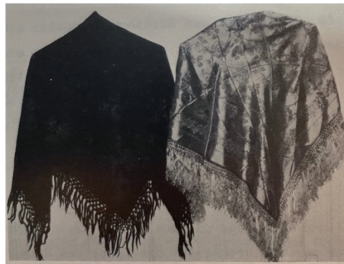
Abb. 12: Das Mitteltuch der Tracht der Bäuerin in Nüdlingen, Vorrhön, um 1900. Links aus Wolle, rechts aus Seide für höchste Feiertage.

Dies gab es sowohl aus Seide, welches nur zu bestimmten Anlässen getragen wurde, als auch aus Wolle für normale Sonn- und Feiertage. 10