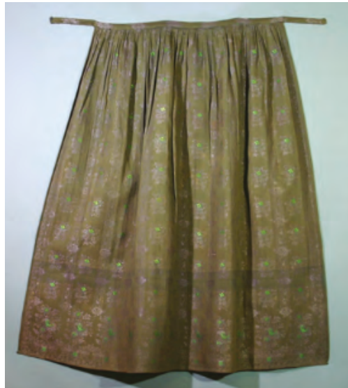
Abb. 3. Seidenschürze, Wathlingen bei Celle, 19. Jh.

Aufgrund der Länge der zwei Schürzenbänder gibt es keine festgelegte Konfektionsgröße, sodass die Schürze sowohl weit als auch eng geschnürt und somit von Trägerinnen mit unterschiedlichen Kleidergrößen getragen werden kann (vgl. Abb. 5).