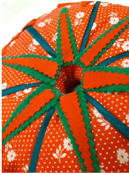
Abb. 8: Großer Filzstern auf der roten Seite.