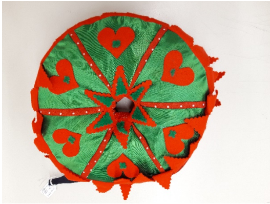
Abb. 4: Erste Seite des Tragekissens.