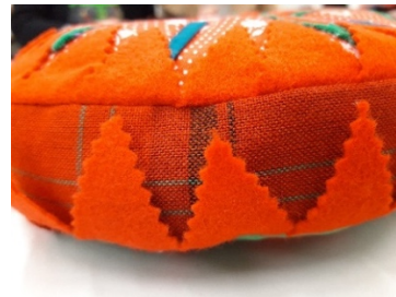
Abb. 2: Eingenähte Filzdreiecke.