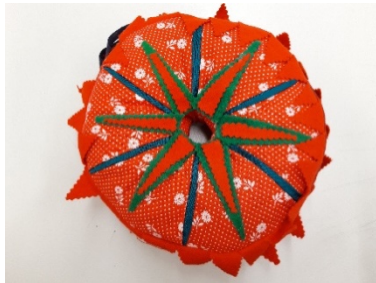
Abb. 1: Gesamtes Tragekissen

Das ringförmige Kissen (TRC 2016.0480, https://tinyurl.com/3yryw79h ) hat einen Durchmesser von 22 cm und besitzt in der Mitte ein 3 cm breites Loch (vgl. Abb. 1). Es ist von einem circa 4 cm breiten karierten Streifen am äußeren Rand eingefasst und insgesamt ungefähr 7 cm dick. An die Seitennaht sind dicht an dicht rote Filzdreiecke mit einem gewellten Rand eingenäht, deren Spitzen nach außen zeigen. Der eingenähte Rand ist immer 2 bis 3 cm breit und die Dreiecke besitzen insgesamt eine Länge von 3,5 bis 4 cm (vgl. Abb. 2). An der Naht, an der beide Enden des karierten Stoffes zusammengenäht sind, ist ein kleiner Lederstreifen an den Seiten mit eingefasst, so dass eine Schlaufe zum Tragen entsteht (vgl. Abb. 3).