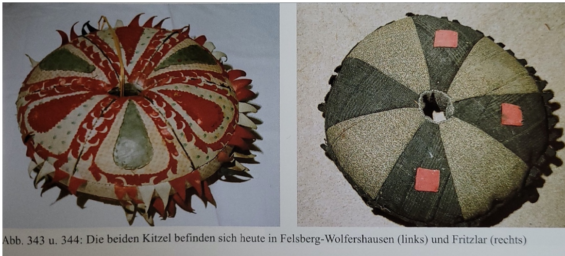
Abb. 10: Kitzel aus dem Museum Heimatstuben Wolfershausen und Abb. 11: Kitzel aus dem Regionalmuseum Fritzlar.

Trachtentradition: Das hessische Tragekissen wurde bis in die 1960er Jahre als Alltagsgegenstand, aber auch als Bestandteil der hessischen Bauerntrachtenkultur in Dörfern des Marburger Landes genutzt. Es diente nicht nur der Selbstdarstellung und indirekten Kommunikation, weil es Teil der Trachten war, sondern es hatte einen praktischen und notwendigen Nutzen für die Frauen im Dorf. Bauernfrauen und -mädchen benutzten das auch als „Kitzel“ oder „Ketzeln“ bezeichnete Kissen als Polster für eine Traglast auf dem Kopf. 1