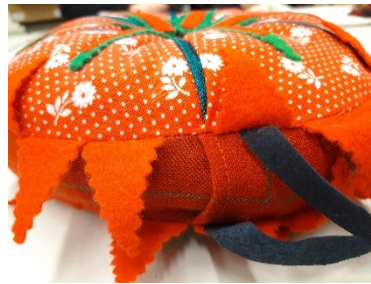
Abb. 3: Eingefasster Lederstreifen zum Tragen.

Beide Seiten des Kissens sind in sechs gleichgroße dreieckförmige Teile gegliedert, die durch dünn eingenähte Streifen in einer anderen Farbe visuell betont werden. Eine Vorder- oder Rückseite lässt sich nicht definieren, da beide Seiten mit Liebe zum Detail gestaltet wurden (vgl. Abb. 4 und 5).