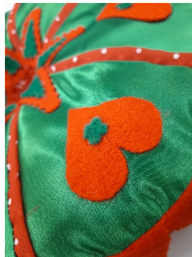
Abb. 7: Rotes Herz mit grünem Kleeblatt.

Die rote Seite besteht aus einem roten Stoff mit weißen Blumen und kleinen Punkten. Sie ist durch in die Länge gezogene Filzdreiecke geprägt, die von dem kleinen Loch in der Mitte sternförmig nach außen ragen. Auch hier wird mit dem Komplementärkontrast von Rot und Grün gespielt, nur, dass in diesem Fall der grüne Stern größer ist und der kleinere Stern aus rotem Filz auf diesen aufgeklebt wurde. Die sechs Abschnitte auf der roten Seite sind aus einem dunkelgrünen/ blauen eingenahten Taftstoff voneinander abgegrenzt (vgl. Abb. 8).