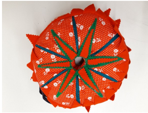
Abb. 5: Zweite Seite des Tragekissens.

Auf der grünen Seite bestehen die sechs Teile aus einem grünen Taftstoff, die durch einen roten, weiß gepunkteten Taftstoff voneinander abgegrenzt sind. Zudem lässt sich in der Mitte, ausgehend vom Rand des Lochs, ein kleiner Stern erkennen, dessen Zacken jeweils in einen der sechs Teile ragen. Er besteht aus größeren roten Filzdreiecken, auf die kleinere grüne Filzdreiecke gesetzt wurden und somit der Stern nochmals hervorgehoben und kontrastiert in Szene gesetzt wird (vgl. Abb. 6). Der Kontrast von Rot und Grün wird erneut bei dem Motiv des Herzens aufgegriffen. In jedes der sechs Teile ist ein rotes Herz aus Filz auf den grünen Taftstoff geklebt, welches durch jeweils ein kleines, grünes Kleeblatt aus Filz verziert ist. Hier wird die Handarbeit besonders sichtbar, da Klebereste deutlich zu sehen sind und nicht alle Kleeblätter und Herzen identisch aussehen (vgl. Abb. 7).