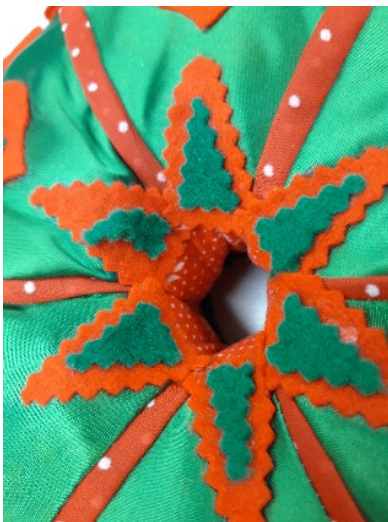
Abb. 6: Stern aus Filzdreiecken.

Auf der grünen Seite bestehen die sechs Teile aus einem grünen Taftstoff, die durch einen roten, weiß gepunkteten Taftstoff voneinander abgegrenzt sind. Zudem lässt sich in der Mitte, ausgehend vom Rand des Lochs, ein kleiner Stern erkennen, dessen Zacken jeweils in einen der sechs Teile ragen. Er besteht aus größeren roten Filzdreiecken, auf die kleinere grüne Filzdreiecke gesetzt wurden und somit der Stern nochmals hervorgehoben und kontrastiert in Szene gesetzt wird (vgl. Abb. 6). Der Kontrast von Rot und Grün wird erneut bei dem Motiv des Herzens aufgegriffen. In jedes der sechs Teile ist ein rotes Herz aus Filz auf den grünen Taftstoff geklebt, welches durch jeweils ein kleines, grünes Kleeblatt aus Filz verziert ist. Hier wird die Handarbeit besonders sichtbar, da Klebereste deutlich zu sehen sind und nicht alle Kleeblätter und Herzen identisch aussehen (vgl. Abb. 7).