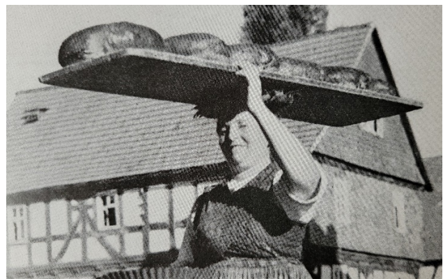
Abbildungen 12 und 13: Gebrauch des Kitzels einer Marburger Bäuerin zum Transport von Brot.

Die unterschiedlichen Regionen entwickelten ihre eigenen Trachtentraditionen und stellten im Ganzen eine kulturelle Struktur und einen „Ausdruck einer dörflich-bäuerlichen Lebensordnung, in der die Werte und Normen des Besitzes, der Altersstufen, des Familienstandes auch das äußere Erscheinungsbild bestimmten,“ dar. 7 Somit lässt sich schließen, dass auch die Gestaltung des Kitzels eine bedeutende